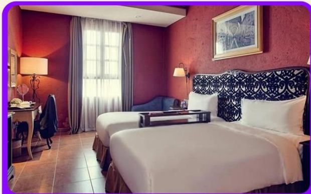
พักบนบานาฮิลล์ 1 คืน