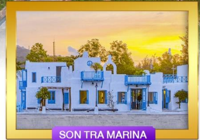
SON TRA MARINA