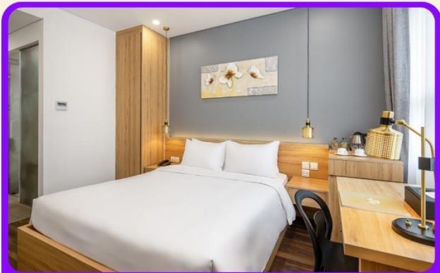
พักเมืองดานัง 4 ดาว 2 คืน