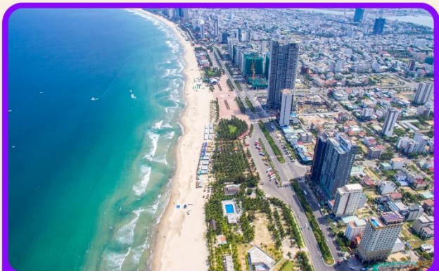
เซ็ควิน ชายหาดหมีคว เป็นชายหาดที่สวยงามที่สุดในเมืองดานัง