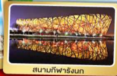
สนามกีฬาโอลิมปิก