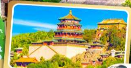
พระราชวังฤดูร้อน