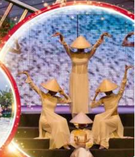
Charming Danang Show