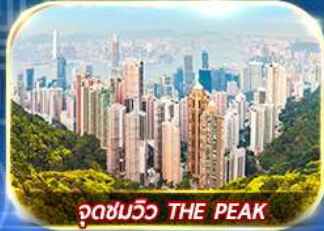
จุดชมวิว THE PEAK