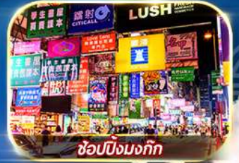
ซ้อปิ้งมังกิก

เต็มอิ่ม ทั้งไหว้พระขอพร การเงิน การงานความรักและซ้อปิ้ง