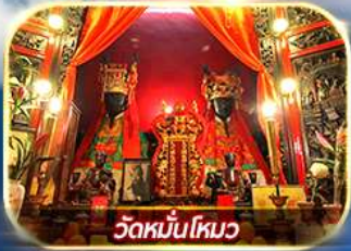
วัดหมื่นโหมว