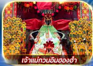
เจ้าแม่กวนอิมสองฮ่า