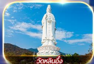
วัดหลันอิ่ง