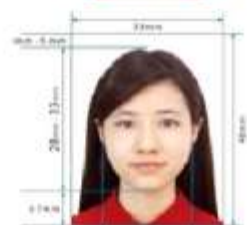
35mm x 45mm Paper Photo for Visa Application Form