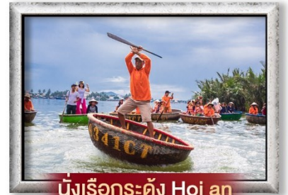
นั่งเรือกระดิง Hoi an