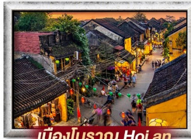
เมืองโบราณ Hoi an