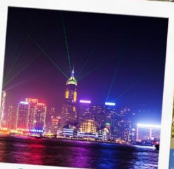
โชว์ SYMPHONY OF LIGHT