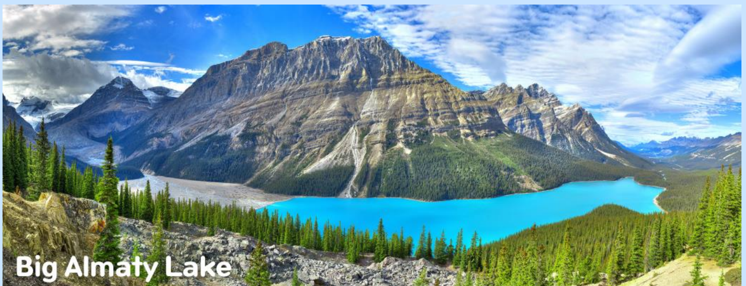
Big Almaty Lake

เช้า รับประทานอาหารเช้า ณ ห้องอาหารโรงแรม