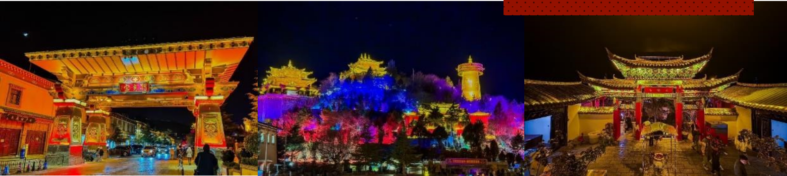
รวมทั้งรูปปั้นทองสัมฤทธิ์ที่มีชื่อเสียงมากที่สุด

หากใครได้ไปหมอบถือว่ามิบุญ หากผู้ใดได้ยื่นเสียง ถือว่าระวังจะนำโชคมาให้