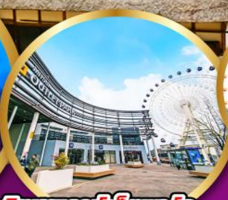
มิตซูเอากะไลท์พาร์ค เซนได