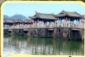
• สะพานโบราณกว้างจี