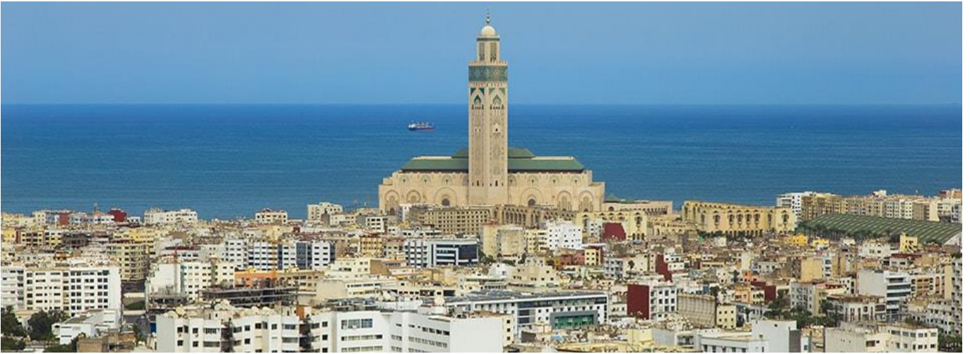
📍 พักในโรงแรมเมืองคาซابلังก้า KENZI TOWER HOTEL หรือเทียบเท่า