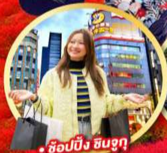
• ช้อปปิ้ง ชินจูกุ

กิจกรรมใส่ชุดกิโมโน พร้อมชมโชว์การแสดงต่างๆ