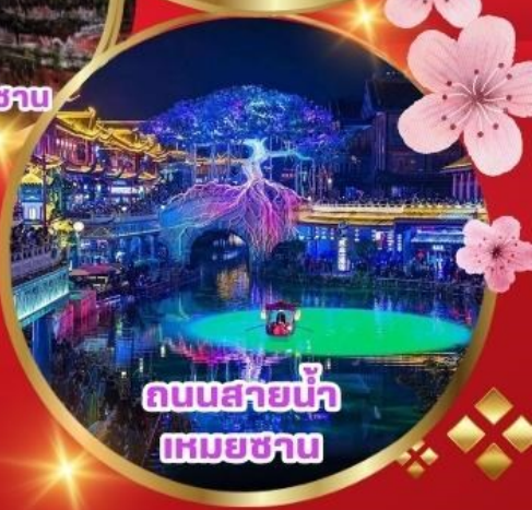
ถนนสายน้ำเหมยซา