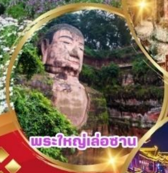
พระใหญ่เส้อซา