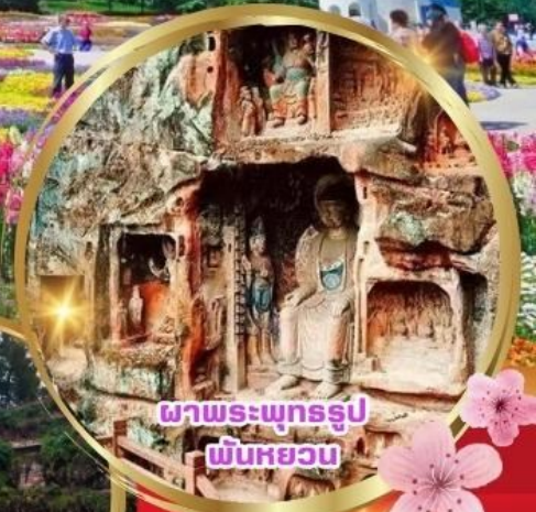
ผาพระพุทธรูปพันหยวน