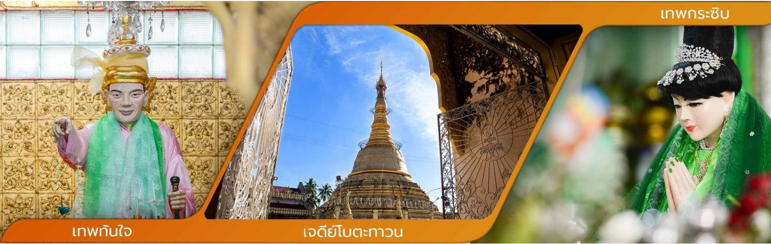
เทพทันใจ

คำบูชาเทพทันใจ เอหิ สักกะ มหามัทโปะโปะจีโปตะถ่องสิทธิมัตถุ อิทังพะลัง เอตัสสะมิงรัตตะนัง พุทธัง ธัมมัง สังฆัง เทวานัง ประสิทธิลาโภ ชยโยนิจจัง วันทามิสัพพะทา สวาโหม