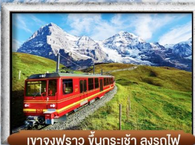
เขาจุงเฟรา ขึ้นกระเช้า ลงรถไฟ