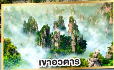
เวาอวดาร