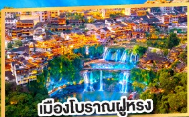
เมืองโบราณฟูหลง