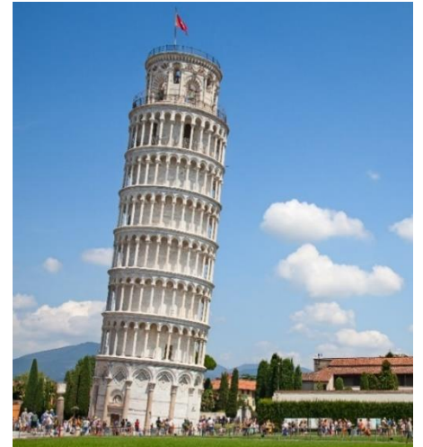
Highlight ! หอเอนปิซ่าเคยเป็นสถานที่กาลิเลโอมาพิสูจน์เรื่องแรงโน้มถ่วงของโลก