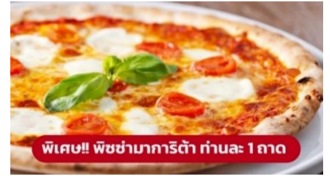
พิเศษ!! พิซซ่ามาการิตต้า ท่านละ 1 ถาด

นำท่านถ่ายรูปด้านนอก มหาวิหารดูโอโมแห่งมิลาน (Duomo di Milano) เป็นมหาวิหารที่ใหญ่เป็นอันดับสองของโลกและรูปแบบการสร้างสถาปัตยกรรมแบบกอธิคที่ใหญ่ที่สุดในโลก มียอดแหลมบนหลังคา มากถึง 135 ยอด จนได้รับฉายาว่า "วิหารเม่น" บนยอดที่สูงที่สุดมีรูปปั้นทองขนาด 4 เมตร ของพระแม่มาดอนน่า