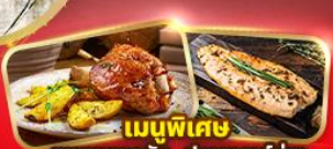
เมนูพิเศษ ขามูเยอร์มัน ปลาเทราต์ย่าง