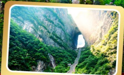
เวาเทียนเหมินซาน

ทริปเดียวเที่ยว 2 เมืองโบราณ ฝูหลงและเฟิ่งหวง ลิ้มรส สุกี้เด็ด บั๊อย่างเกาหลี เปิดปิกนิก