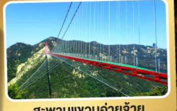
สะพานแวงนอ้ายจ้าย