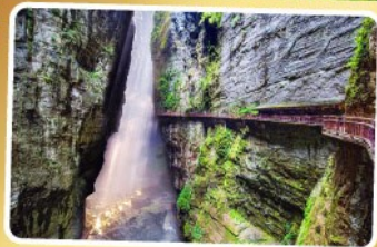
หุบเขารอยแยกอุหลิงซาน