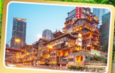
หงหย่าตัง