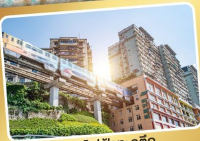
รถไฟฟ้ากระสุนตึก

GO CHINA อั่งซิง อุหลิงซาน อุหลง ต้าจู้ 重庆 5วัน4คืน