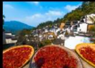
หมู่บ้านโบราณหวงหลิง