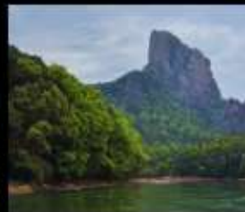
มรดกโลกภูเขาเต๋