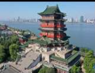
โฮเอินหวัง