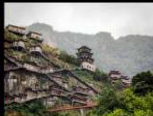
หุบเขาเกวตา