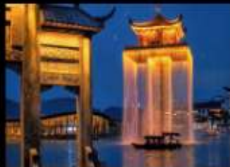
อู๋หมี่โจว