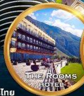
THE ROOMS HOTEL

★ ดินเนอร์สุดหรู ณ ภัตตาคาร ที่ตั้งอยู่บนยอดเขาที่ Restaurant Funicular 79,900 บาท