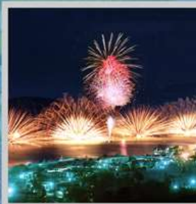
"TOYA FIREWORK FESTIVAL"