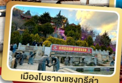
เมืองโบราณแซงกรี่ล่า