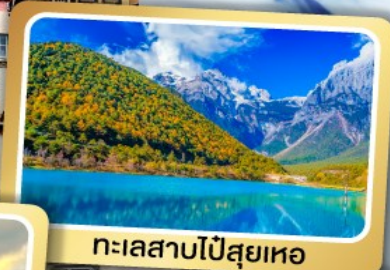
ทะเลสาบโป๋สุยเหอ