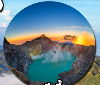
คาวาจีเจียน