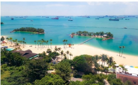
หาดซิลโซ