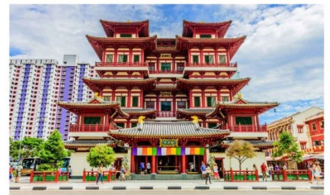
วัดพระเขี้ยวแก้ว