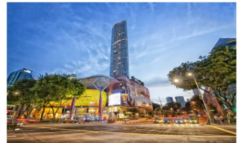
ซอปปิงออร์ชาร์ด