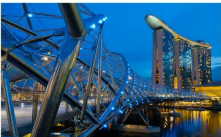
สะพานเฮลิคซ์