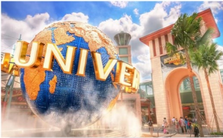
ยูนิเวอร์แซล สตูดิโอ