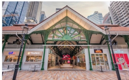
Lau Pa Sat Food Center