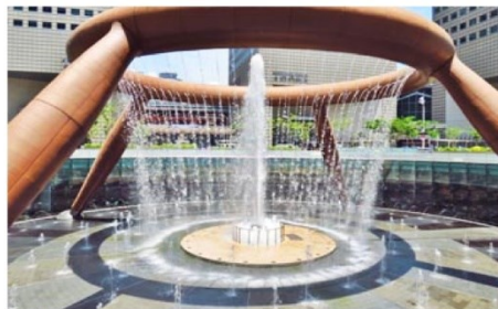
น้ำพุแห่งโซคลาก