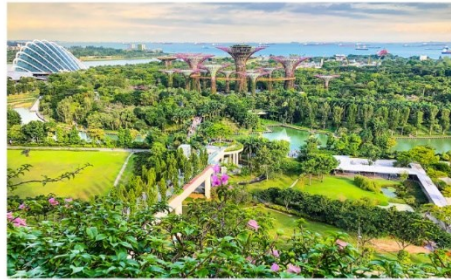
การ์เด็น บาย เดอะเบย์