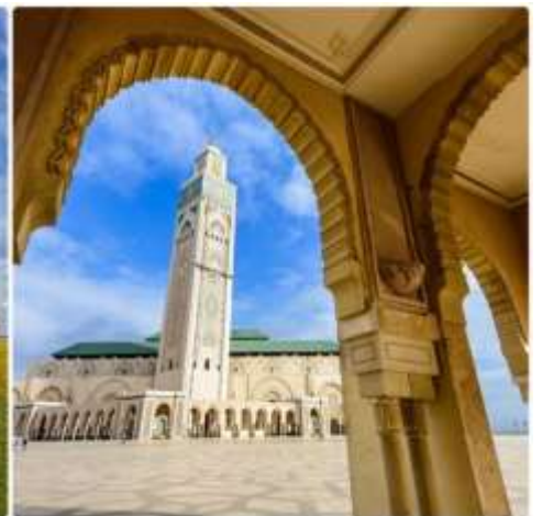
4 *ภาพใช้เพื่อการโฆษณาเท่านั้น*