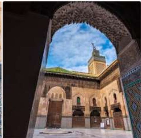
13 *ภาพใช้เพื่อการโฆษณาเท่านั้น*