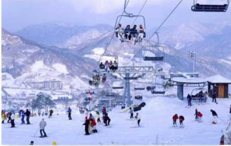
กิจกรรมลานสกี