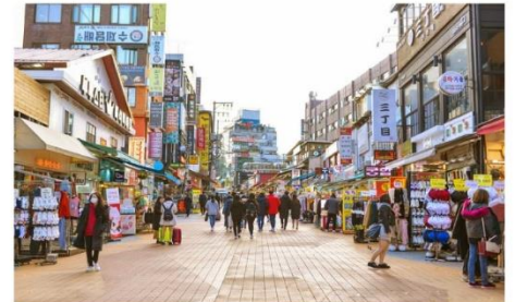
ย่านฮงแด