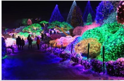
ชมเทศกาลประดับไฟฤดูหนาว