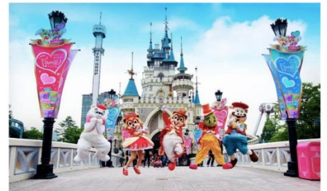
ลือตเต็วิลด์