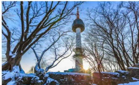
โซลทาวเวอร์