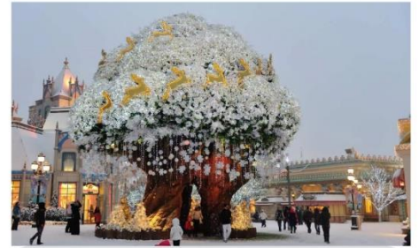
สวนสนุกเอเวอร์แลนด์