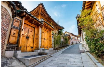
หมู่บ้านโบราณบุกชอน