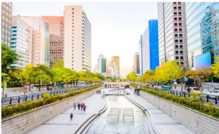
คลองชองเกซอน