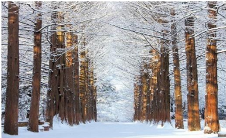
เกาะนามิ