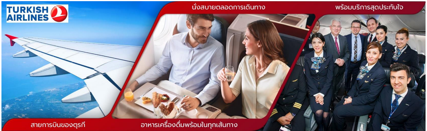
สายการบินของตุรกี

23.00 น. ✈️ เหมิรฟ้าสู่ กรุงอิสตันบูล โดยสายการบิน TURKIST AIRLINE เที่ยวบินที่ TK 69 ใช้เวลาเดินทางประมาณ 10 ชั่วโมง (บริการอาหารและเครื่องดื่มบนเครื่อง)