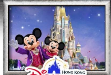
Disneyland HONG KONG

ชมการแสดง แสง สี เสียง Symphony of Lights