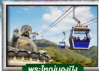
พระใหญ่นองปิง