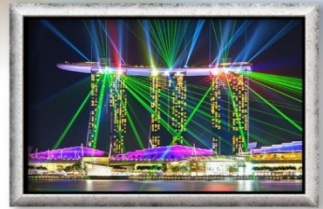
Wonder Full Light & Water Spectacular