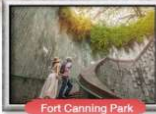
Fort Ganning Park