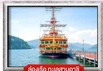
ล่องเรือ ทะเลสาบอาชิ