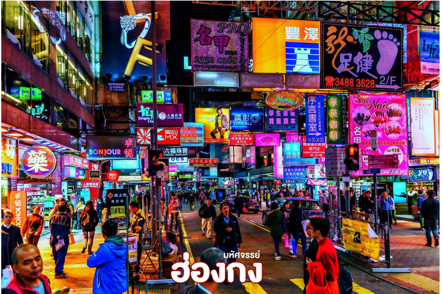
บ้คคจรรยั ฮ่องกง

มากมาย ภายในย่านมีตลาดนัด Ladies' Market ขนาดใหญ่ซึ่งมีร้านขายเสื้อผ้า และของกระจุกกระจิกให้ได้เลือกซื้อมากมาย