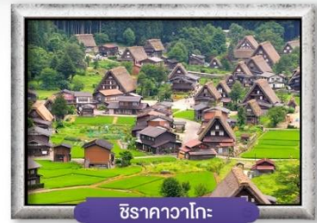
ชิราคาวาโกะ