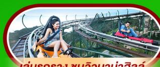
เล่นรถราง ชมวิวบานาฮิลล์

นั่งกระเช้าที่ยาวที่สุดในโลก ขึ้นสู่บานาฮิลล์ ฮอยอัน เมืองมรดกโลกที่สวยงามและเจียบสงบ