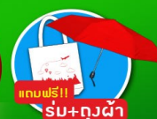
แถมฟรี! รับ+ถุงผ้า