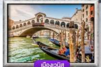
เมืองเวนิส

พิเศษ! หอยเอสคาโก้ + ไวน์แดงฝรั่งเศส | ชีสฟองดูสวิตเซอร์แลนด์ สปาเกี๊ยะร้อนหมักแบบเวนิส