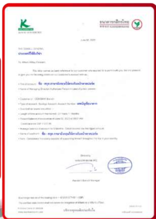
ตัวอย่าง Bank Guarantee ที่ผู้สมัครต้องขอจากธนาคาร