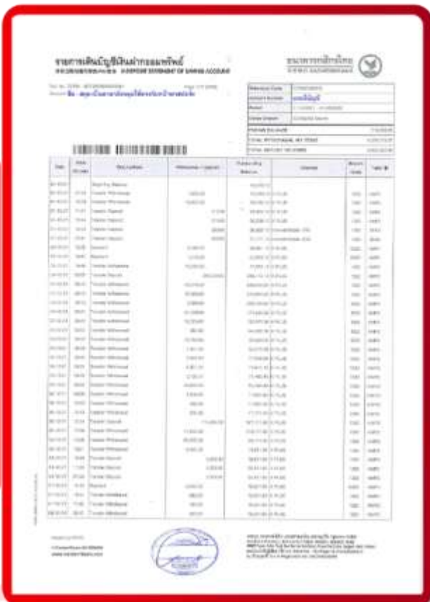
ตัวอย่าง Bank Statement ที่ผู้สมัครต้องขอจากธนาคาร

3.4 ปรับสมุดบัญชีธนาคารตัวจริง และเตรียมไปในวันที่ยื่นวีซ่า