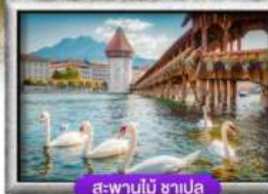
สะพานไม้ ซาเปลา