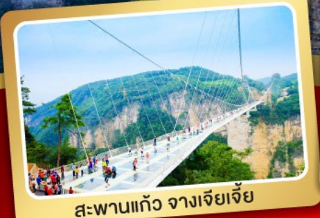
สะพานแกว ฉางเจียเจีย