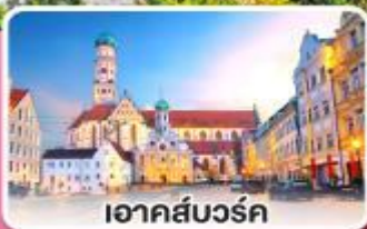
อาคส์บวร์ค