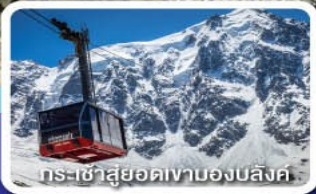
กระเช้าสู่ยอดเขามองบล็องค์

พิสูจน์ความสูง ของสองเขา Top of Europe ยอดเขาจุงเฟรา และยอดเขามองบล็องค์