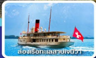
ล่องเรือทะเลสาบเจนีวา