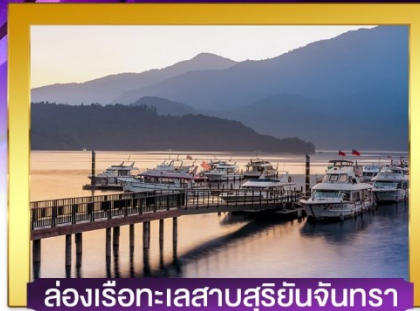
ล่องเรือทะเลสาบสุริยอันจินตรา