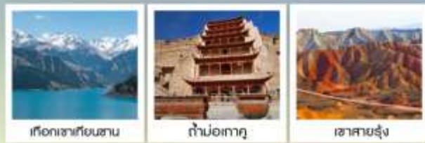
เทือกเขาเทียนซาน

ท่องเที่ยวเรือจีนเจีย / 5ดปังกิงฮือ / ป่าหินแม่น้ำหวงเหอ / กามยนต์ 3 มิติ ระบบคอมพิวเตอร์คู่หูฟาน / กำแพงมอโก / อุทยานจางเย่ต้นเหอใต้ฉงกหววน กำแพงเมืองด่านเจียชี่กวน / เข็มทรายหมิงซาซาน / สระน้ำวงพระจันทร์ / กำแพงเกอ หนู่เป๋านอุบู่ / เมืองโบราณเทาทางกัวง / เรือกษัตริย์ซาน / ส่องเรือทะเลสาบเทียนฉือ