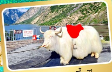
จามริกะเลสาบเตี้ยซี