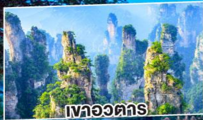
เวาอวตาร