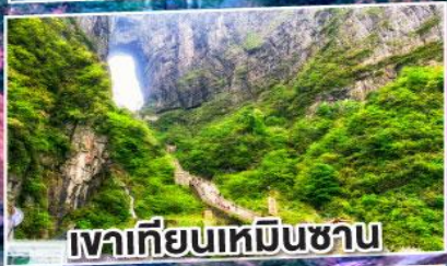
เวาเทียนเหมินซาน