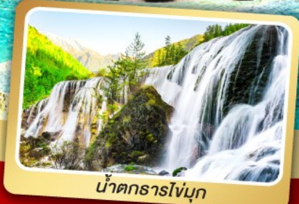
น้ำตกธารไจ่บู