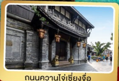
ถนนความใจเซียงจื่อ