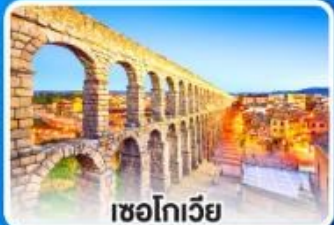
เซโกเวีย