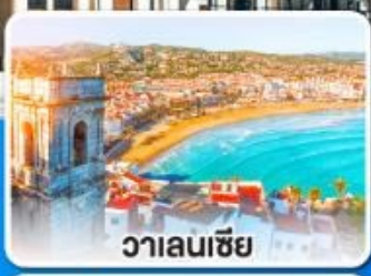
วาเลนเซีย