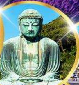
พระใหญ่โตบุทสึ