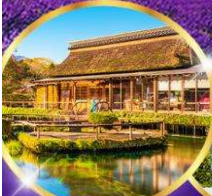
หมู่บ้านไอชิโนะ อักโก

อิสระท่องเที่ยว 1 วันเต็ม "วันอิสระเลือกซื้อ Tokyo Disney"